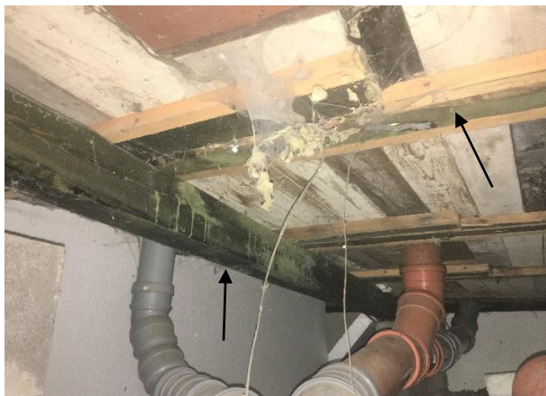
Bärlinor, syll och golvregrar är strukna med träimpregneringsmedel.