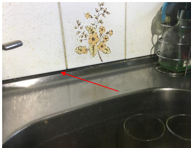
Tätning mellan diskbänk och stänkskydd saknas, kök.