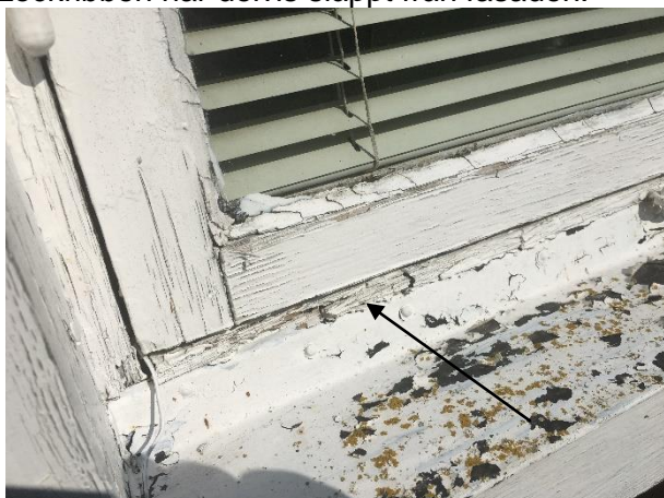
Bottenstycke på fönster mot söder har rötskador.