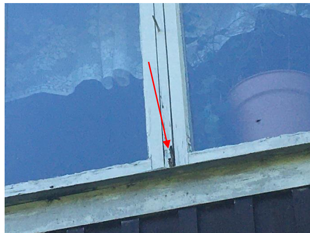
Fönster i gavel mot norr har rötskador.