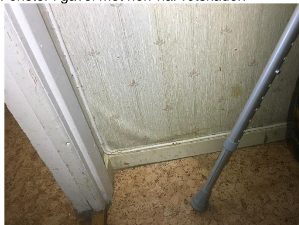
Fuktros på vägg, hall.