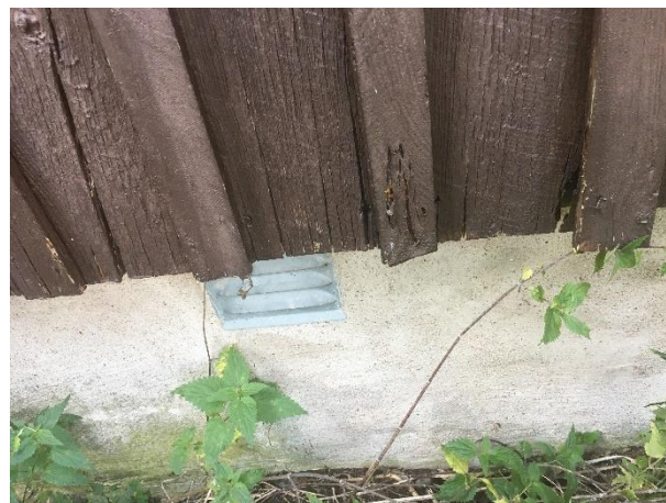
Rötskador i nederkant av panelen.