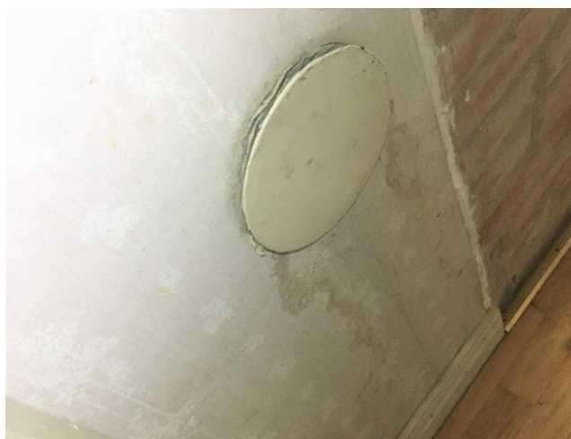
Fuktrosor under öppning in i skorsten, vardagsrum.