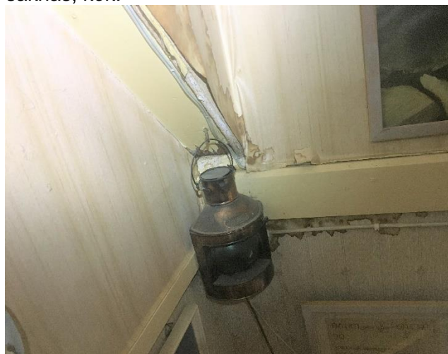
Fuktrosor i tak i anslutning till takkupa över trapp.