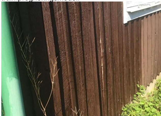
Lockribben har delvis släppt från fasaden.